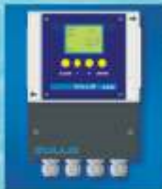
Prevodník b-line II