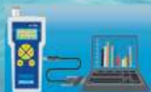
Prenos údajov do PC