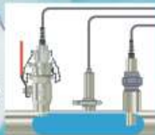
Montáž do potrubia